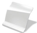
369 - BLANCO GLACIAR