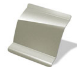
D11 - BEIGE PIMIENTA