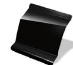
676 - NEGRO NACRÉ