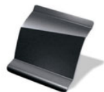
KNS - GRIS CUARZO