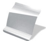
KNH - GRIS ESTRELLA