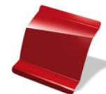
B76 - ROJO FUEGO