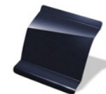
472 - AZUL CREPÚSCULO