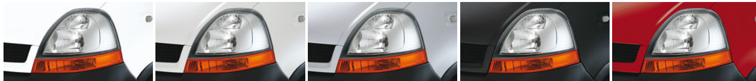
Blanco Glaciar (369)