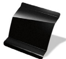
NEGRO NACRÉ · 676