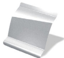
GRIS ESTRELLA · KNH