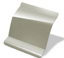
BEIGE PIMIENTA · D11