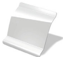
BLANCO GLACIAR · 369