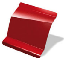
ROJO FUEGO · B76