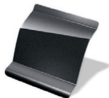
GRIS CUARZO · KNS